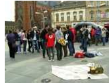
iMOS, Sajam informiranja mladih Osijek

Osim ovih događanja, svake godine se organiziraju različite aktivnosti na otvorenom povodom obilježavanje Dana Europe. I ove godine je organizirana EU ulična frka u Vukovaru, te štandovi povodom EU tjedna ispred zgrade Sisačko-moslavačke županije.