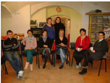
Volonteri iz Novog sada u RICM

angažmana u svojoj organizaciji, te u drugim organizacijama civilnoga društva, djelatnici PRONI Centra su organizirano volontirali priključivanjem akciji «Hrvatska volontira» 21.09.2012. u Vukovaru.