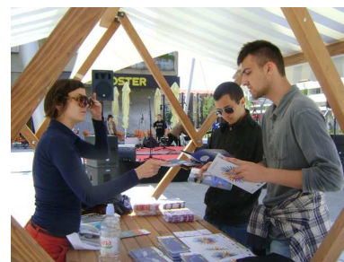
Agencija za mobilnost na iMOSu

Organizirana 2 sajma informiranja mladih, s ukupno 74 izlagača i 700 sudionika