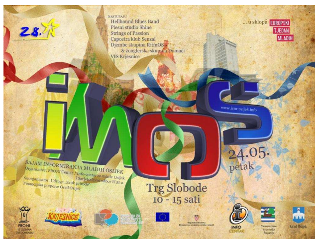
iMOS, Sajam informiranja mladih Osijek