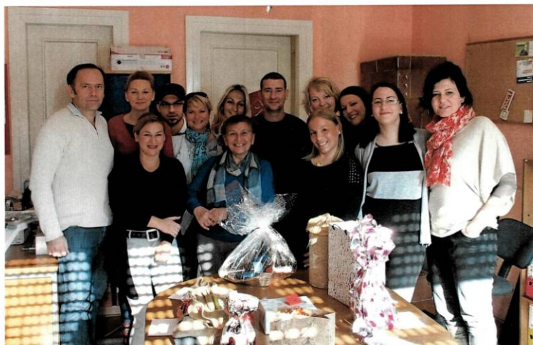
PRONI Centar za socijalno podučavanje

PRONI Centar je, kao partner Nacionalne zaklade za razvoj civilnoga društva, podložan redovitoj reviziji financijskog poslovanja. S obzirom da su svi kriteriji zadovoljeni i nema negativnosti u poslovanju, PRONI Centru odobreno biti partnerom i u narednom programskom razdoblju, a tijekom 2015. nastavljena je institucionalna potpora. Također, kontrole europskih projekata su pokazale da projekti teku predviđenim tempom, te da u sustavu nema pogrešaka.