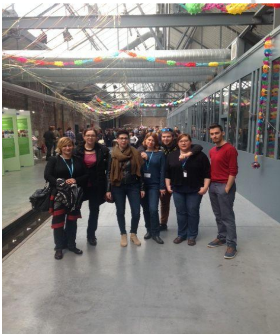
Delegacija RH na 1st Youth Forum

U Strateškom planu jasno je navedeno da je dio organizacijske kulture i orijentacije PRONI Centra biti organizacija koja uči. U skladu s tim stavom, obveza svakog djelatnika je minimalno jednom u polugodištu pohađati seminar, konferenciju, trening, radionicu koji mogu doprinijeti razvoju njihovih individualnih znanja i vještina, ali i podijeliti znanja s ostalim članovima organizacije. Naime, praćenje trendova, širina znanja, brojne vještine potrebni su za učinkovit rad na razvoju zajednice. Poticanje volontera na sudjelovanje u različitim formama izobrazbe je također način ulaganja u kvalitetu ljudskih resursa. Stoga su brojne takve prigode, preko 30 , kojima su djelatnici i volonteri nazočili tijekom 2015. godine.