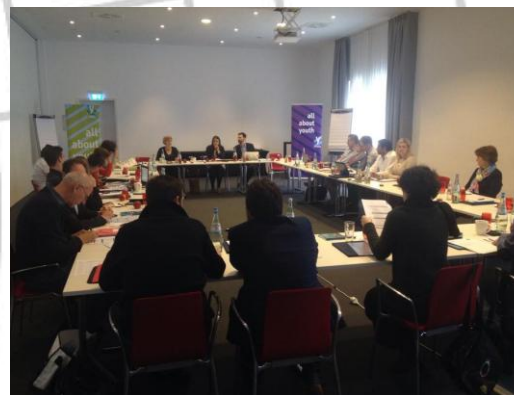
ERYICA Godišnja skupština

European Youth Information and Counselling Agency (ERYICA); European Youth Forum (EYF); Eurodesk, Mreža mladih Hrvatske; Zajednica Info Centara Hrvatske; Regionalni Forum udruga Slavonije i Baranje; Forum socijalnih poduzetnika