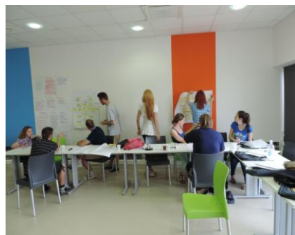
Akademija managementa neprofitnih org.