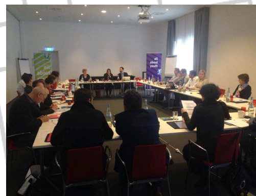
ERYICA Godišnja skupština

Mediji igraju važnu ulogu u javnosti rada PRONI Centra, te prenošenjem informacija, najavama, izvještavanjima doprinose nastojanjima mobilizacije i senzibiliziranja zajednice. Mediji su naše objave popratili s 350 objava o aktivnostima PRONI Centra. Uključene su sve vrste medija na lokalnoj, regionalnoj i nacionalnoj razini. Osobito je dobra popraćenost putem internet portala, te poslovično radio je najzastupljeniji medij. Tijekom 2016. godine bilo je i puno više objava o aktivnostima i projektima u kojima je PRONI Centar partner, npr. projekt Organizacije koje brinu. Ovaj projekt sadržava i izvanrednu suradnju s agencijom za odnose s javnošću. Mi kao organizacija nismo imali takvih ranijih iskustava, ali iz ovog projekta možemo reći da je vrlo pozitivno i za preporuku. Praćenjem objava u medijima, zasigurno će zanimati javnost činjenica da i ove godine, osmu godinu zaredom, jedini medij koji nije imao niti jednu objavu aktivnosti PRONI Centra jest Jutarnji list.