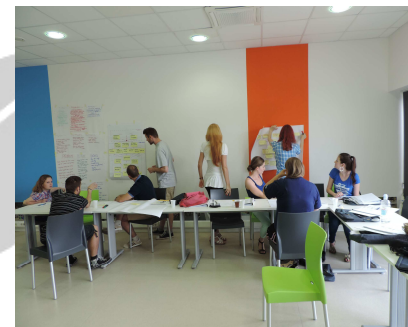
Akademija managementa neprofitnih org.

Ukupno je provedeno 1142,5 sata obrazovnih aktivnosti kroz 163 dana angažmana trenera. To znači da se u prosjeku svaki drugi dan u organizaciji vrši obrazovna intervencija.