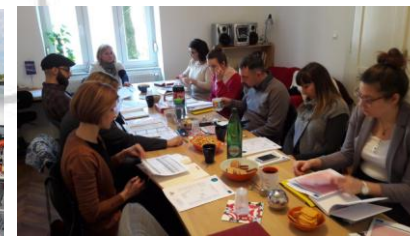
Međužupanijski sastanak Osijek