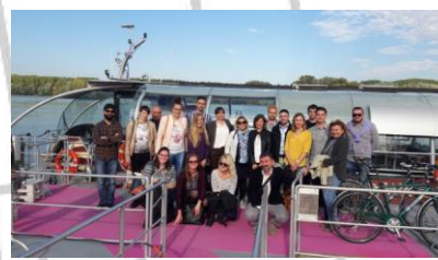
Međužupanijski sastanak Vukovar

Veliki broj fokus grupa, ali i međužupanijski sastanci, osim svog predviđenog rezultata i ostvarivanja cilja, uz aktivno sudjelovanje partnera i međužupanijske sastanke rezultiralo je i značajnim međusektorskim partnerstvom koje predstavlja snažnu platformu za razvoj drugih projekata i procesa.