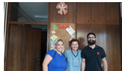
Voditelji ICMova u Vukovaru, Osijeku i Sisku

Informiranje i savjetovanje mladih provodi se kroz projekte Info-centara za mlade u Osijeku, Vukovaru i Sisku i to kombinacijom različitih pristupa i metoda rada. Naravno, sve aktivnosti se temelje na istraženim potrebama mladih, te uz njihovu aktivnu uključenost u kreiranje i provedbu istih.