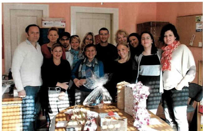
PRONI Centar za socijalno podučavanje