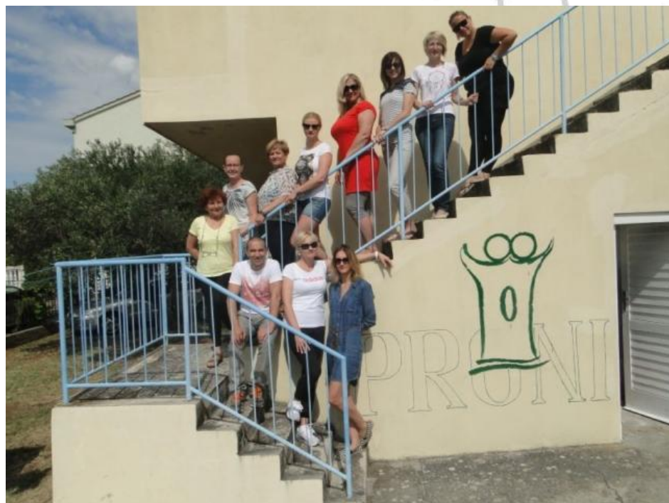
Savjetodavni odbori Info Centara za mlade – institucije i organizacije u službi mladih

Lokalna zajednica i Općina Pirovac i dalje prati sve skupine mladih ljudi, i rado se odazivaju dolasku u centar, kako bi im predstavljali im kulturno, biološko, ali i gastrološko bogatstvo ove male, ali bogate i raznolike zajednice. Njihova uključenost značajna je i za ukupni dojam i doživljaj koji su mladi ljudi ponijeli iz Trening centra, Pirovca, ali za mnoge i Hrvatske.