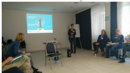
Cross over Orahovica