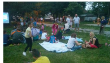
Američki piknik u Tenji

Suradnja sa Sveučilištem Indiana iz SAD, Fakultet socijalnog rada, razvijanjem redovnog predmeta Intercultural Learning Service – practice in Croatia dobila je sustavni oblik i pretvorila se u partnerstvo koje je i ove godine urodilo posjetom i studentskom praksom studenata sa Sveučilišta Indiana. Studijska posjeta koja se dogodila u svibnju 2017. u trajanju od 10 dana, obuhvatila je rad i u drugim organizacijama u Osijeku, poput Volonterskog centra Osijek, Ne-ovisnosti, ali i upoznavanje s radom još dodatnih udruga poput Breze i projekta Dokkice, Vukovarskih iskrica, Europskog doma Vukovar, Udruge podrške i pomoći žrtvama i svjedocima na sudu, Crveni križ Osijek, Udruga Pobjede, Nansen dialog centar Osijek, Udruga invalida rada Vukovar. Dakle program se provodi na području Osječko-baranjske i Vukovarsko-srijemske županije.